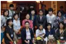
(一社) 埼玉建築士会 女性委員会

まだまだ女性が少ない建設業界で女性が働くことは、簡単なことではないですが、だからこそ女性の新しい視点から意見を発信することが、今後の建設業界の発展にも繋がったと思っています。そのためにも、技術者として更なる専門知識や現場管理力を習得していきたいです。