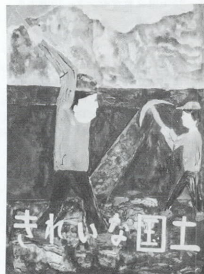
原田さんの作品<小学校の部>