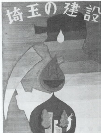
加藤さんの作品<中学校の部>