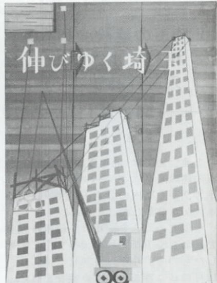
高橋さんの作品<中学校の部>