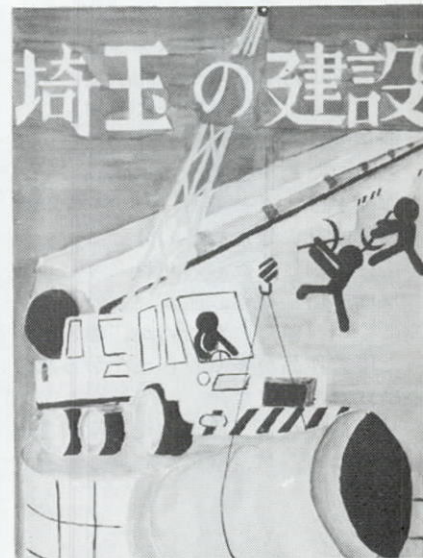
阿瀬君の作品<小学校の部>